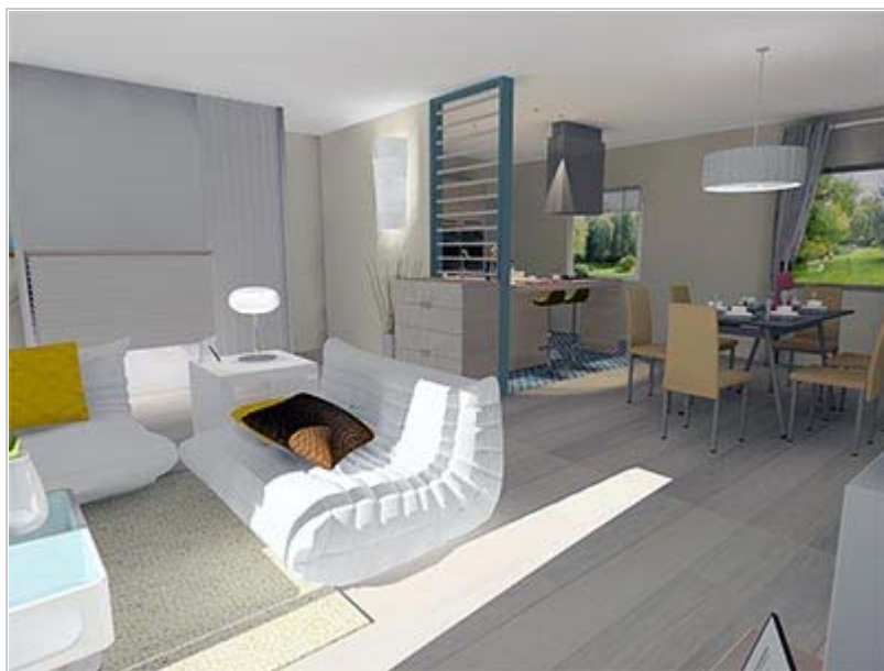
Amélia Gomez va proposer des visites virtuelles 3D et panorama 360°

Attesté par les statistiques, le procédé de la valorisation immobilière permet de stimuler la vente d'un bien immobilier.