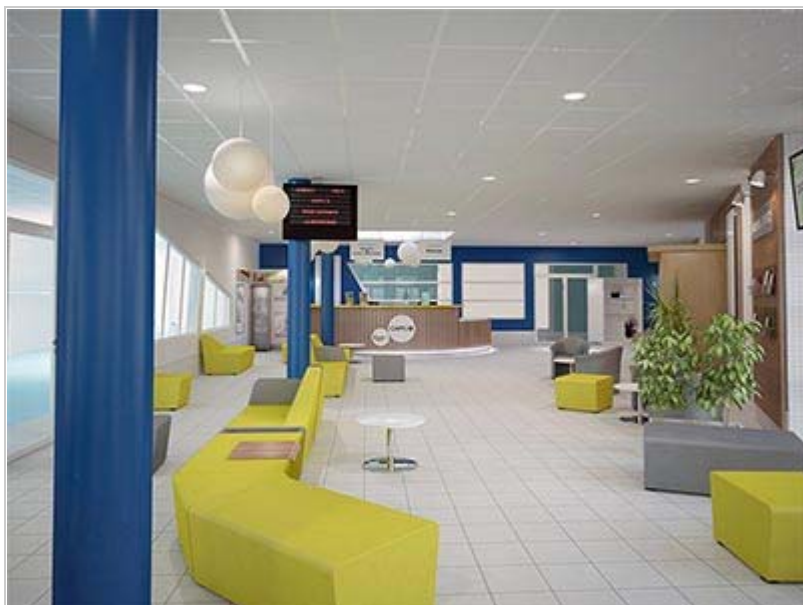
Visuel 3D de l'espace d'accueil du Centre aquatique Capf'IO (© Déc'home Staging)